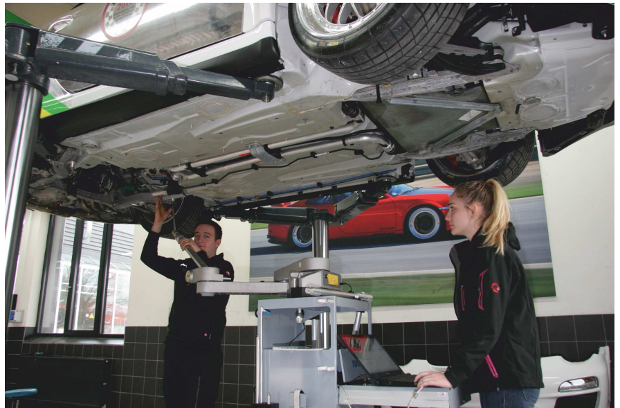
Vermessen des Karosserie-Unterbodens und der Fahrwerksgeometrie