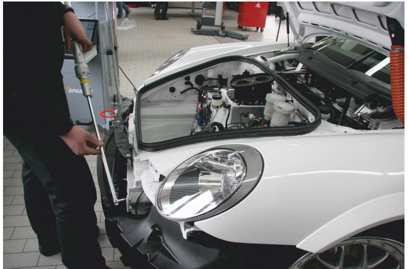
Deformierte Längsträger beim Frontschaden? Eine Vermessung schafft Klarheit!

unterstreicht den Nutzen der Karosserievermessung: Der verursachte Wildschaden an einem Porsche 911 Turbo S Cabrio zeigte eine komplett verformte Frontschürze mit verbogenem Aluminium-Träger und einen stark beschädigten Frontdeckel. Das Wildtier war nach dem Aufprall über das Fahrzeugdach geschleudert worden, sodaß eine Deformation des Daches möglich wäre. Der Sachverständige stimmte einer Karosserievermessung zu. Die Kontrolle des Vorbaus ergab die richtige Maßhaltigkeit der Federbeindome.