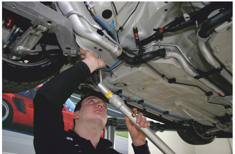
Eigene Mess-Punkte können definiert, fotografiert und abgespeichert werden