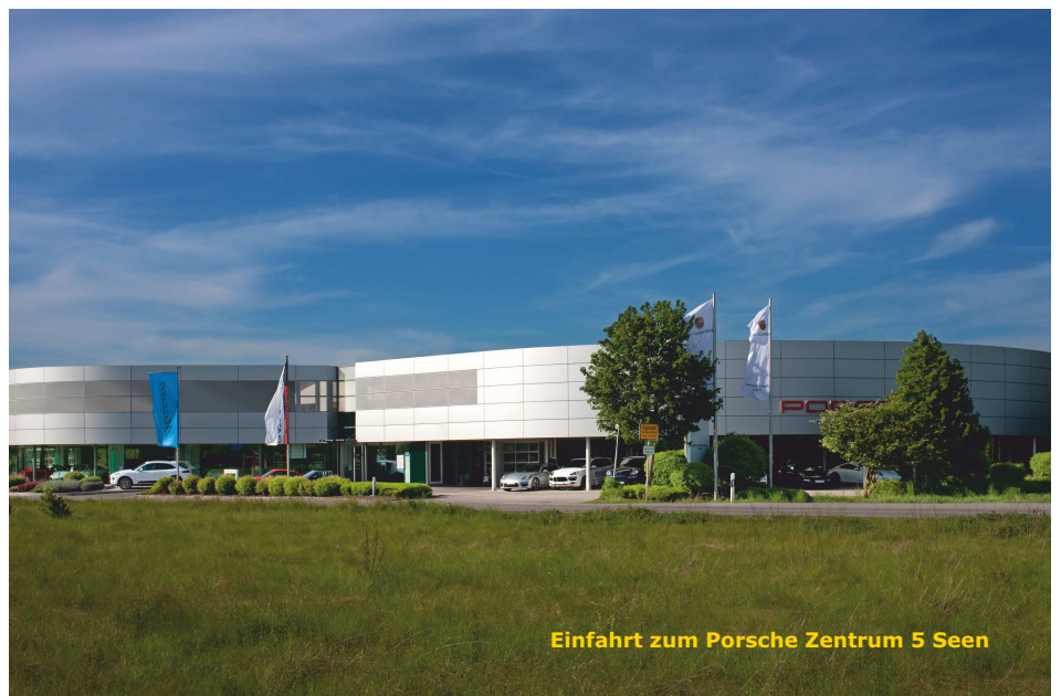
Einfahrt zum Porsche Zentrum 5 Seen

unterstreicht der Geschäftsführer des Porsche Zentrum 5 Seen.