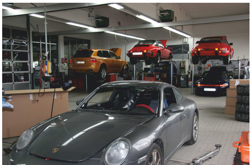
Leasing-, Gebraucht- oder Classicfahrzeuge kommen zum Service und zur Reparatur