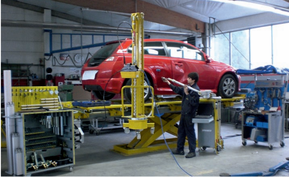
Blick in die Pilz-Werkstatt: Werkzeuge von Spanesi und das Miracle-Ausbeulsystem von Carbon