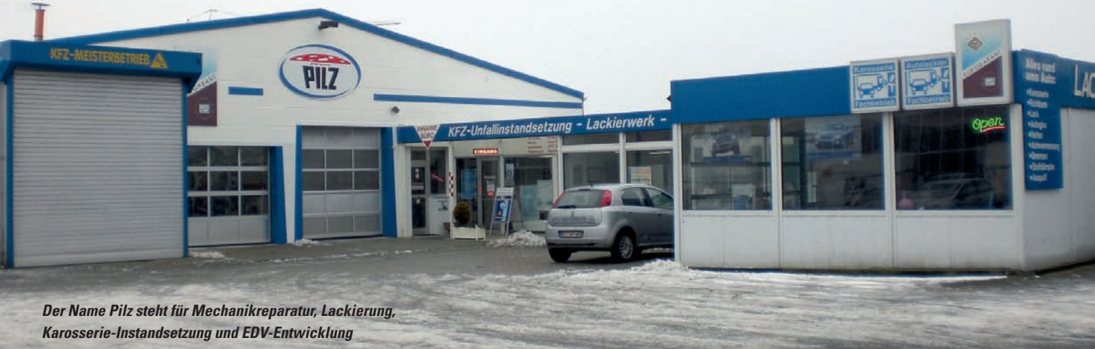
Der Name Pilz steht für Mechanikreparatur, Lackierung, Karosserie-Instandsetzung und EDV-Entwicklung